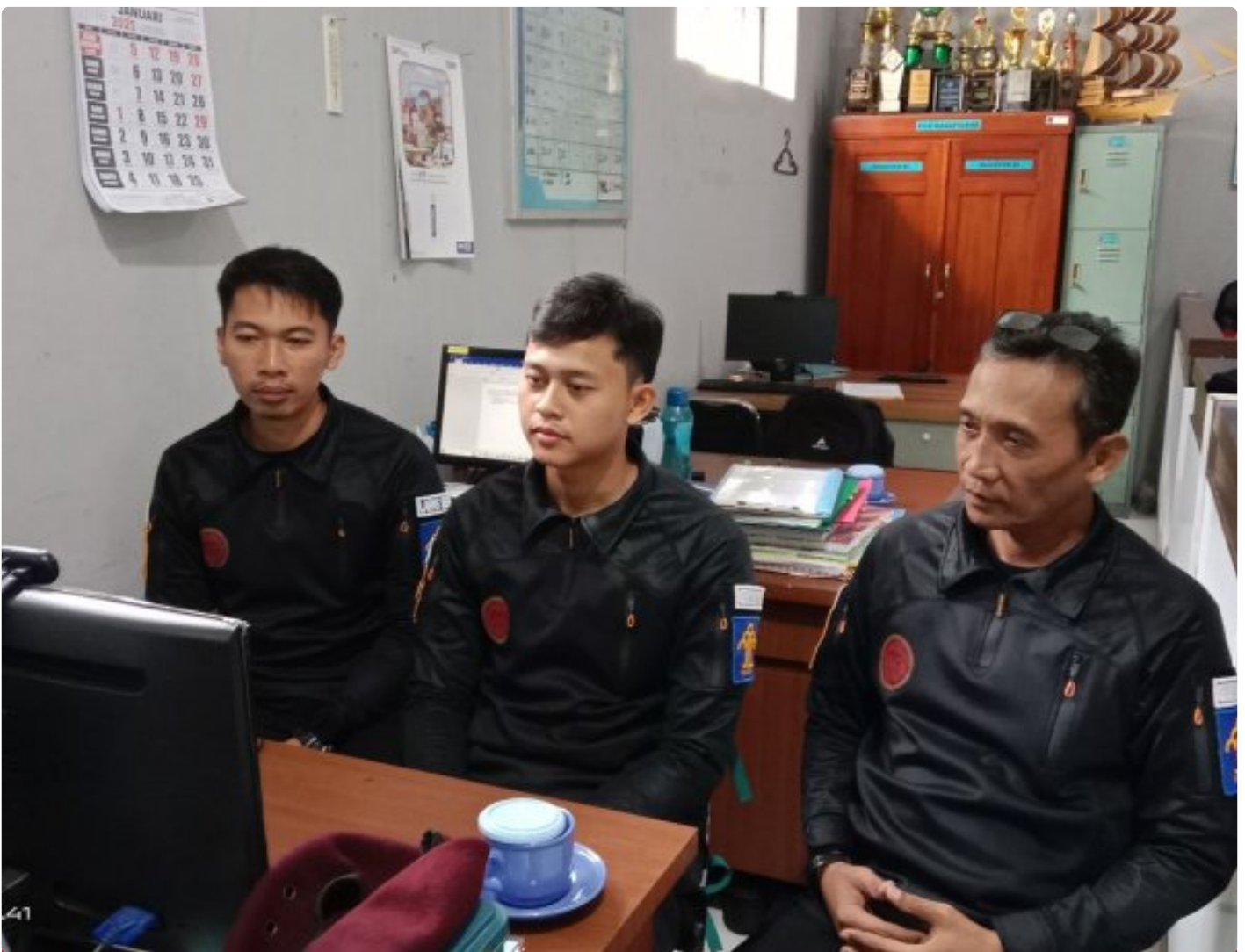
Bangun Harmoni dan Strategi, Lapas Besi Ikuti Webinar Refleksi Akhir Tahun 2024 & Resolusi 2025

CILACAP – Sebagai salah satu langkah dalam pengembangan kompetensi bagi Aparatur Sipil Negara (ASN), Petugas Lembaga Pemasyarakatan Kelas IIA Besi berpartisipasi dalam kegiatan webinar bertajuk "Refleksi Akhir Tahun 2024 dan